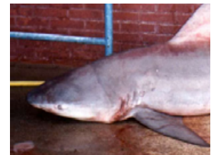
Pag 19 - Cabeça-chata ( Carcharhinus leucas )