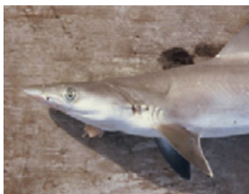
Pag 20 - Frango ( Rhizoprionodon porosus )