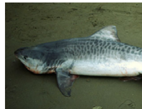
Pag 18 - Tigre ( Galeocerdo cuvier )