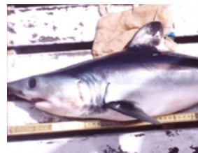
Pag 22 - Mouka ou Golfinho ( Lamna nasus )