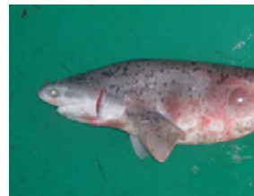
Pag 14 - Bruxa ( Notorynchus cepedianus )