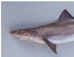
Pag 12 - Cola-fina ou Roliço ( Mustelus schmitti )