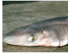
Pag 06 - Bagre ( Squalus acanthias )