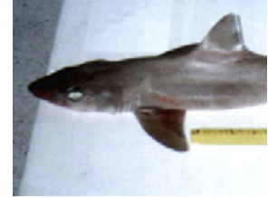
Pag 11 - Sebastião ou Boca-de-velha ( Mustelus canis )