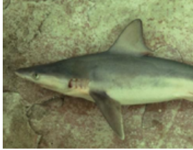
Pag 08 - Galhudo ( Carcharhinus plumbeus )