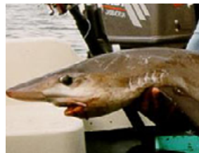
Pag 13 - bico-doce ( Galeorhinus galeus )