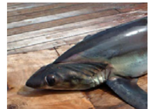
Pag 15 - Raposa ( Alopias superciliosus )