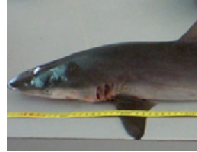
Pag 10 - Lombo-preto ( Carcharhinus falciformis )