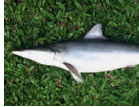
Pag 09 - Azeiteiro ( Carcharhinus porosus )