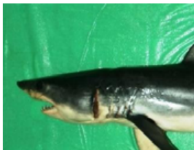
Pag 16 - Anequim ou mako ( Isurus oxyrinchus )