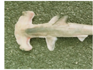
Pag 07 - Martelo ( Sphyrna spp. )