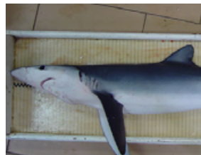
Pag 17 - Azul ( Prionace glauca )