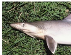
Pag 16 - Frango ( Rhizoprionodon lalandii )