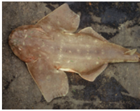
Pag 04 - Anjo-de-asa-curta ( Squatina occulta )