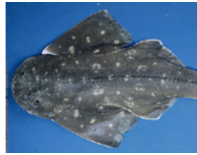
Pag 05 - Anjo-espinhudo ( Squatina guggenheim )